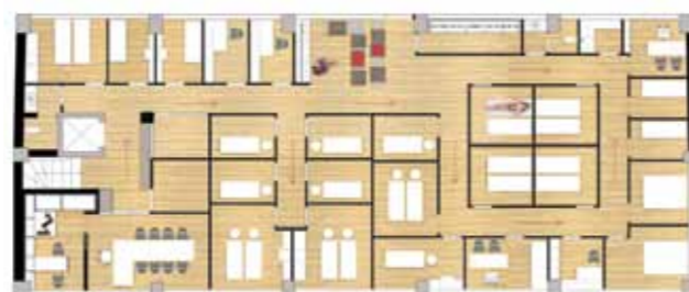
Κάτοψη α' ορόφου